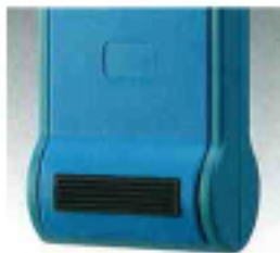
ドアを傷つけないダンバー